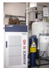
微量 NMR (核磁気共鳴装置)

大量分取した微量成分の組成情報 (TOF/MS) 及び構造情報 (NMR) を取得し、分子構造解析が可能